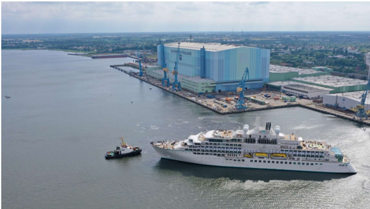
3 Auslaufen der Chrystal Endeavor im Juli 2021