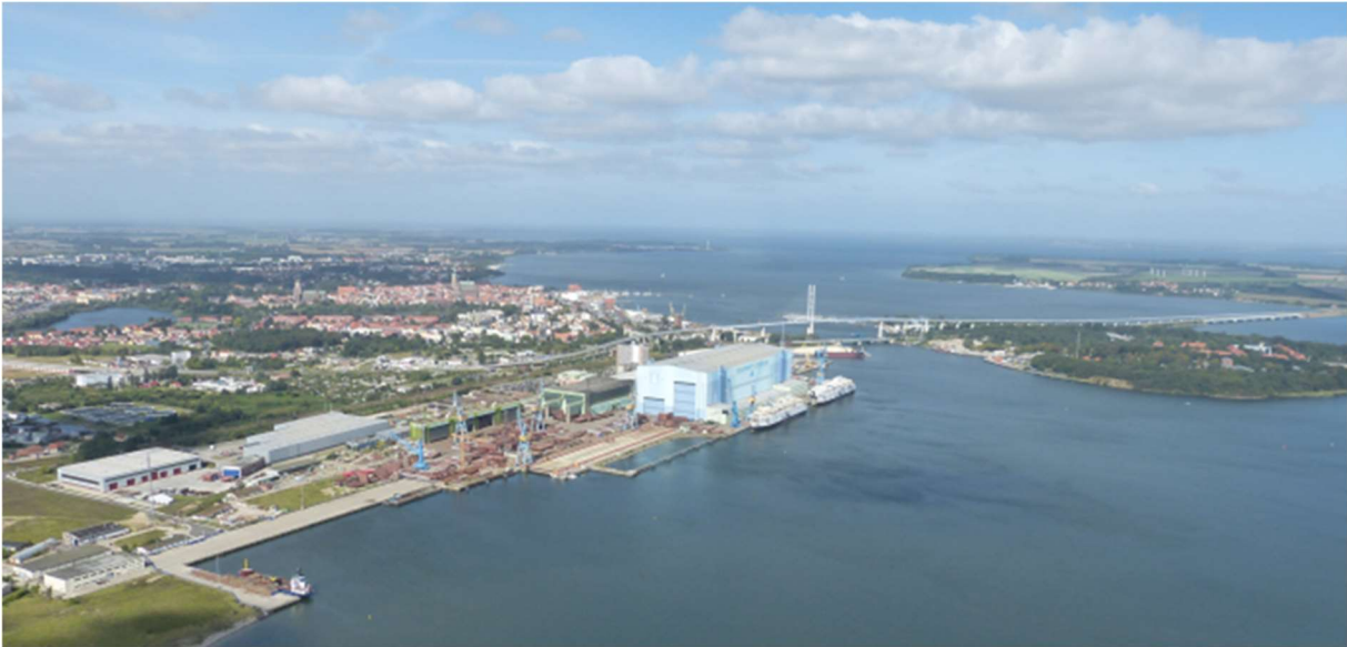
2 Blick über Strelasund und Rügenbrücke

Über viele Jahrhunderte wurde die Geschichte der Hansestadt Stralsund neben dem Handel auch durch die maritime Wirtschaft maßgeblich bestimmt. Schon in der Hansezeit (1421) verzeichnete das Stadtbuch dreizehn Werften. Der Schiffbau zieht sich strukturbestimmend durch die Geschichte der Hansestadt Stralsund bis in die heutige Zeit.