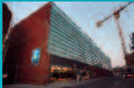
Parkhaus „Am Hafen“ geöffnet: 06:00 – 22:00 Uhr