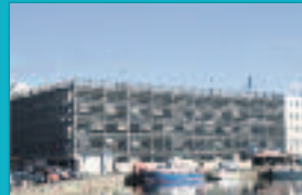
Parkhaus „Am Ozeaneum“ geöffnet: 06:00 – 22:00 Uhr

Die Zentrale im Parkhaus „Am Hafen“ ist in der Zeit von Montag bis Freitag von 08:00 Uhr bis 19:00 Uhr besetzt. Am Samstag von 08:00 Uhr bis 15:00 Uhr. Die restliche Zeit wird über die Rufbereitschaft abgegolten. Telefon 03831-2882894, Email: parken[at]leg-stralsund.de